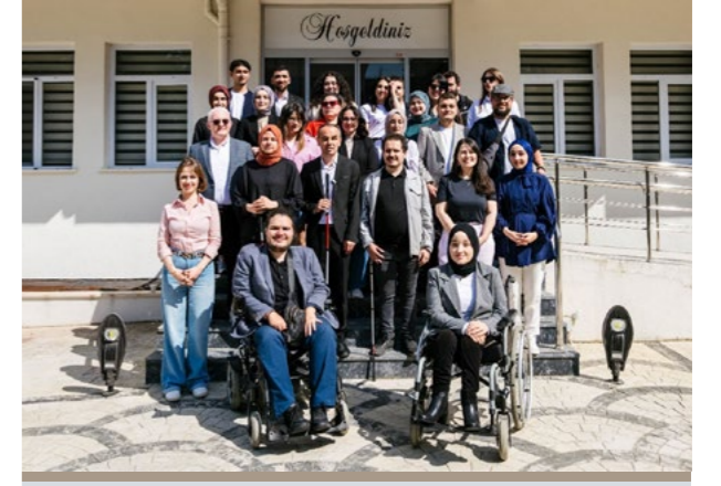
Yerel Savunuculuk Akademisi