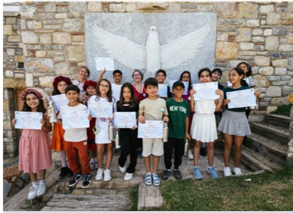
Kızıl Kirazkuşu: Datça'da İklim Değişikliği Odağında Kuraklıkla Mücadele