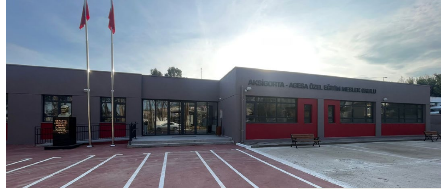
Aksigorta-Agesa Özel Eğitim Meslek Okulu, Hatay

2025 yılında Hatay'ın Kırkhan ilçesinde Aksigorta-Agesa Özel Eğitim Meslek Okulu tamamlanarak hizmete açıldı.