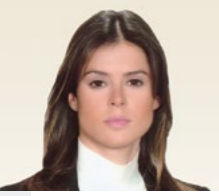
Serra Sabancı Mütevelli Heyeti Üyesi