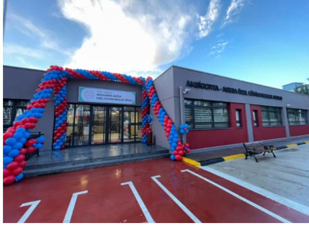
Aksigorta Agesa Özel Eğitim Meslek Okulu, Hatay