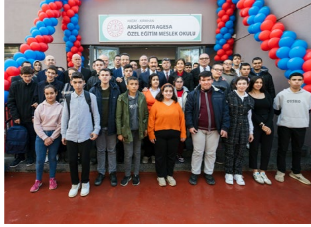
Aksigorta Agesa Özel Eğitim Meslek Okulu, Hatay