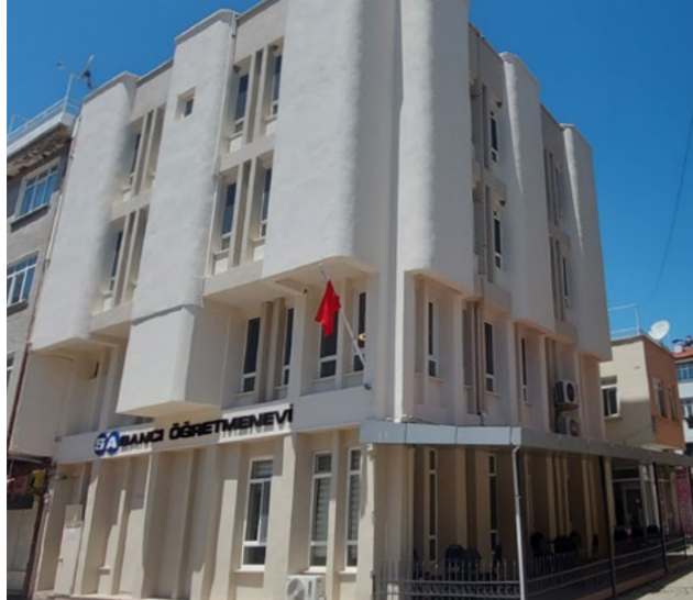
Sabancı Öğretmenevi, Isparta