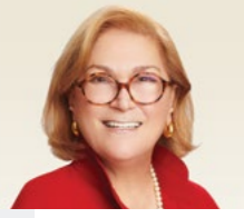
Güler Sabancı Mütevelli Heyeti Başkanı ve İcra Komitesi Başkanı