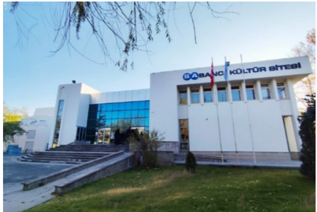
Sabancı Kültür Sitesi, Kayseri

Şartlı bağışçı fonları dahil 10 kalıcı esere bakım-onarım yaptırıldı, 6 kalıcı esere bakım onarımları için destek verildi. 18 kalıcı esere şartlı bağışçı fonları dahil, çeşitli destekler vermeye devam edildi.