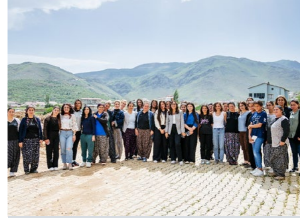
Dayanışma İyileştirir: Kadından Kadına Sağlık